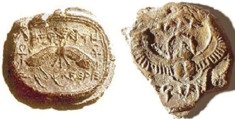
Слика 1: Два печата цара Језекије: с леве стране је фотографија скоро оtkривеног печата, а с десне је фотографија раније оtkривеног, али ништа мање необичног печата.

Наиме дана 02. децембра 2015. год. медији су објавили 31 да је на једном од археолошких налазишта у Јерусалиму пронађен још један печат јудејског